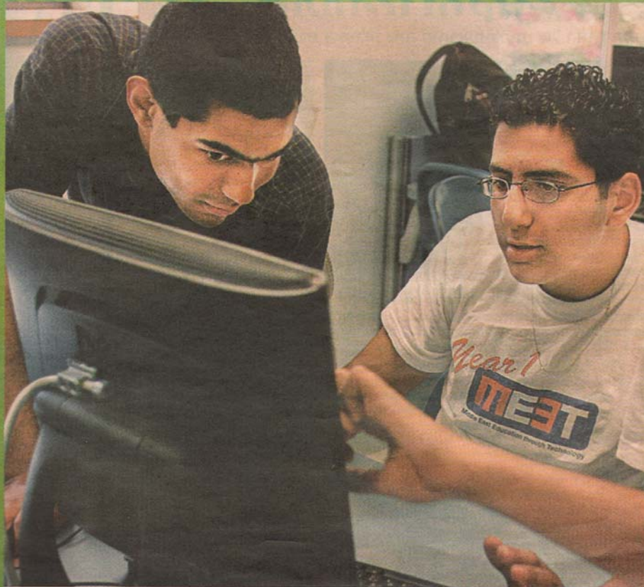
בונים גשר בין העמים באמצעות שפת הטכנולוגיה. משתתפי מרויקט MEET